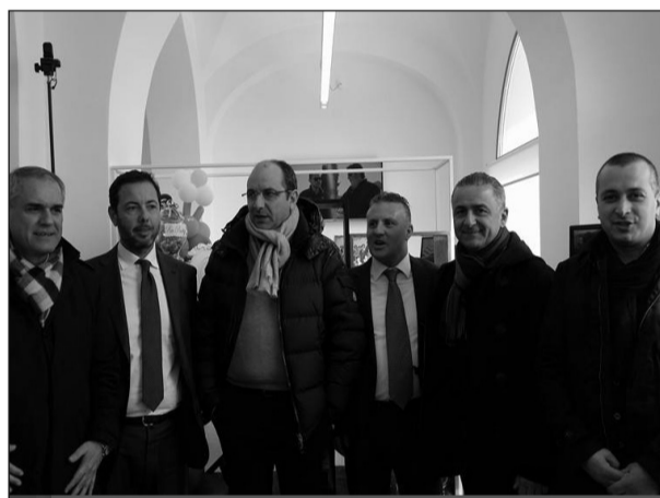
L'inaugurazione del Centro di Informazione ed Accoglienza turistica di Manfredonia

ma turistico locale, proponendo opportuni punti di contatto con i turisti che visitano i luoghi, per fornire adeguate informazioni sugli itinerari possibili e su come trascorrere in serenità la permanenza in loco. Uno strumento in grado di valorizzare, a fini turi-